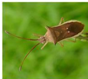
写真6 ホソハリカメムシ成虫 (体長 9～11mm)