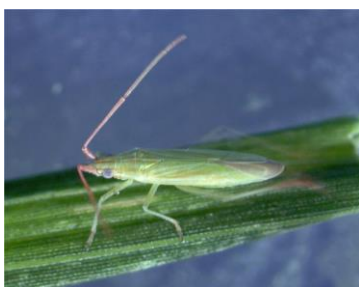
写真5 アカヒゲホソトリカスミカメ成虫 (体長 5～6mm)