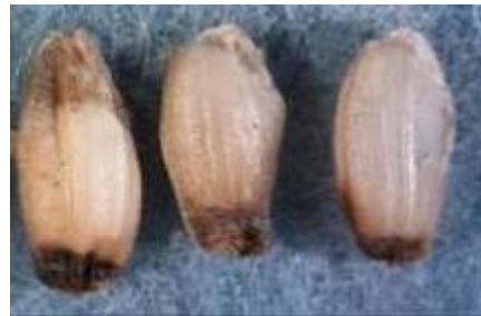
写真4 アカスジカスミカメによる被害粒 (斑点米)