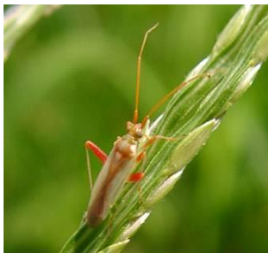
写真3 アカスジカスミカメ成虫 (体長 5～6mm)