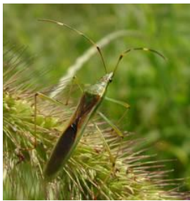
写真1 クモヘリカメムシ成虫 (体長 15～17mm)